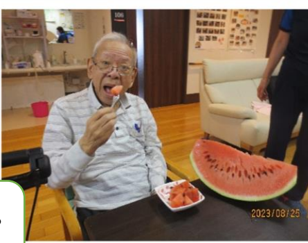
GH本郷恒例のスイカ割り行いました。 今年も大盛り上がりでした。