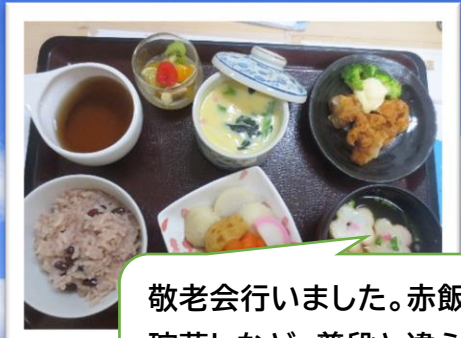
敬老会行いました。赤飯や手作り茶碗蒸しなど、普段と違う食事で好評でした