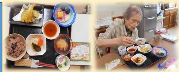
美味しい料理をいただきました

今まで社会に尽くしてこられた利用者の皆様の長寿のお祝いをしました。理事長と管理者の細貝から皆様へ感謝の言葉とご挨拶をさせていただきました。これからもお元気に大庭デイサービスに通っていただきたいと思います。