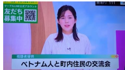
マーブルテレビで 放送されました

この度、敬仁会の施設に勤務するベトナムからの若い介護人材が生活するシェアハウス東出雲がオープンとなり、東出雲町揖屋の町内会の皆様との交流会が2月15日(木)に開かれました。社会福祉法人敬仁会では、主にベトナムから特定技能1号の介護人材の積極的な受け入れを行っています。世界で最も早く超高齢化社会を迎えている日本で、海外からの介護人材に日本の進んだ介護福祉技術を伝えることは、世界的な共有と協力の一環と考えています。交流会ではベトナム料理が提供され、地域の皆様との和やかな交流となりました。