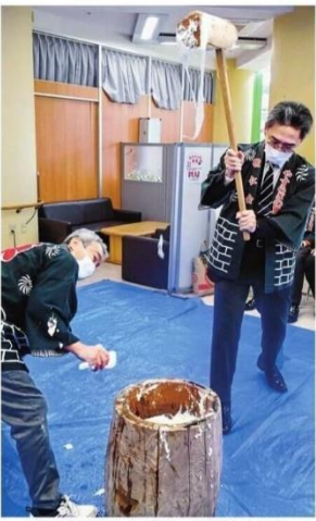
きねを振り上げて、餅をつく参加者—松江市佐草町、敬仁会